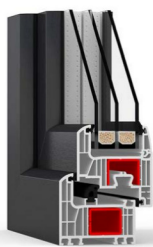
Iglo Energy Classic